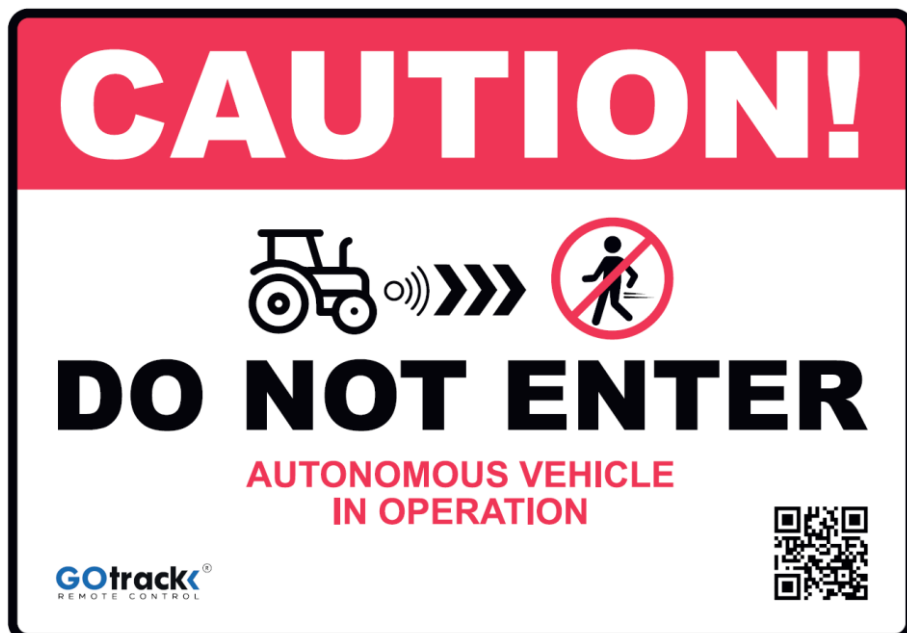
Grafika 4. Wzór znaku ostrzegawczego, format A3