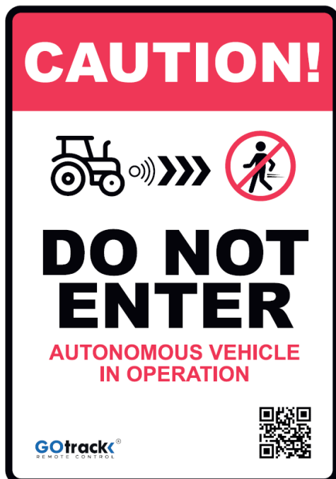
Grafika 3. Wzór znaku ostrzegawczego, format A4

Oznaczenia powinny być zgodne z poniższą grafiką: